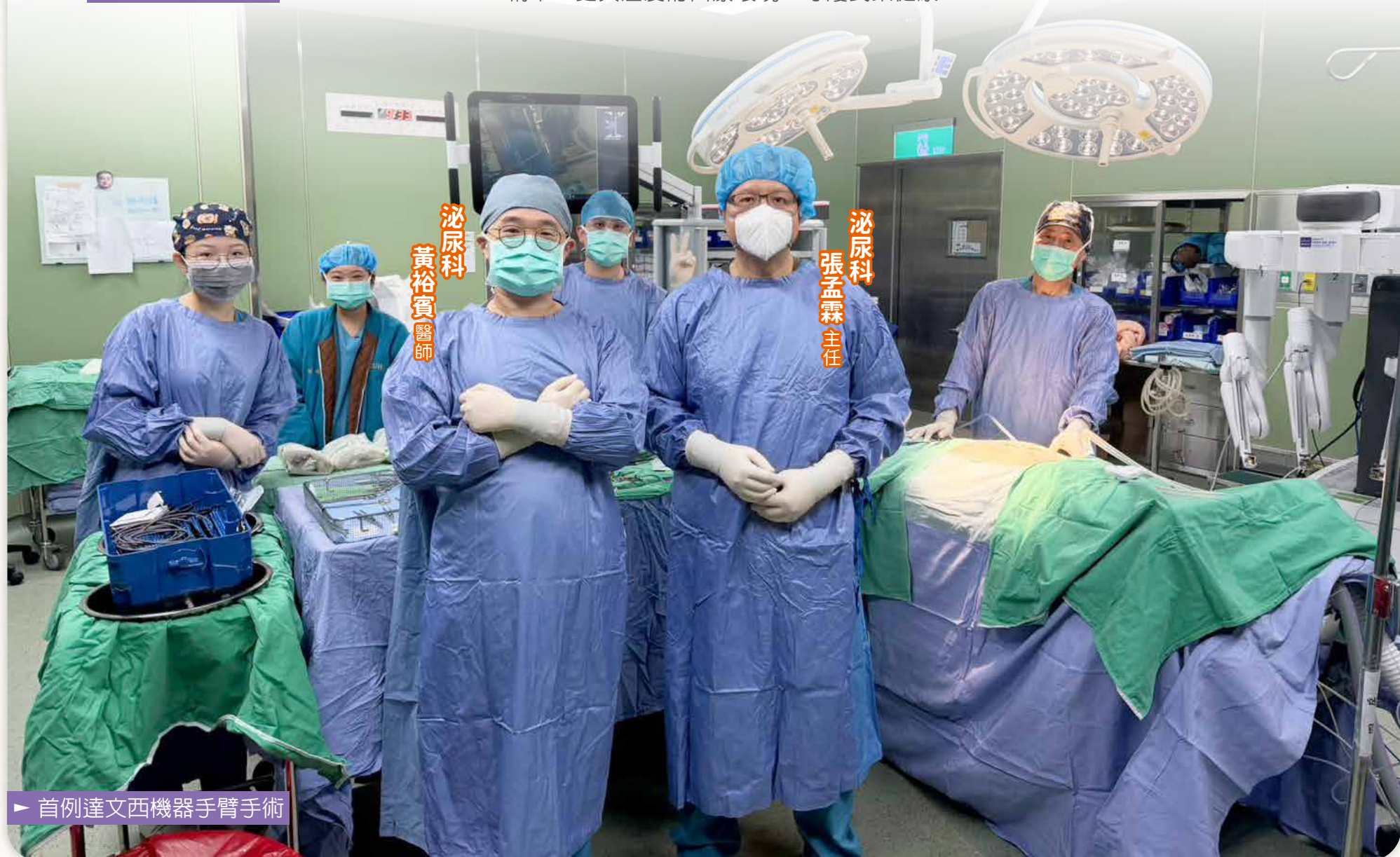
▶ 首例達文西機器手臂手術

除泌尿科外，達文西系統亦可逐步應用於一般外科、婦產科、胸腔外科等不同專科領域，擴大精準微創手術的服務範圍，造福更多病友。隨著智慧醫療與精準醫療時代來臨，機器手臂手術不僅代表醫療科技的進步，更象徵醫療照護模式的全面升級。未來，輔大醫院將持續秉持「以病人為中心」的核心理念，結合尖端科技設備、專業醫療團隊與人本關懷精神，不斷精進醫療品質，打造更安全、更精準、更具溫度的醫療環境，守護民眾健康。